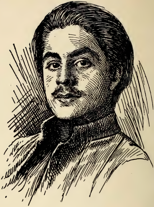
﴿ جبران خليل جبران ﴾